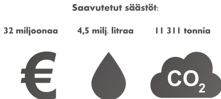
Kuva 2. Kehittämissuunnitelman (2014-2017) toimenpiteiden ansiosta saavutetut säästöt.

Kehittämissuunnitelman toimenpiteiden ansiosta Helsingin kaupunki säästi vuosina 2014–2017 kaikkiaan noin 32 milj. euroa, 4,5 milj. litraa polttoainetta ja 11 300 tonnia hiilidioksidipäästöjä. Tähän päästiin erityisesti kaupungin rakennushankkeiden välisellä massojen koordinoinnilla, maa-ainesten välivarastoinnilla ja jalostuksella sekä hyötykäyttökohteiden suunnittelulla ja toteutuksella.