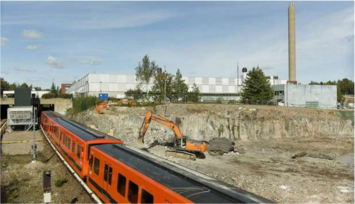
Kuva 2: Myllypuron kampuksen rakennustyömaa syysk

Vastaavasti sosiaali- ja terveysalan suuri uudistuksia mahdollisuuksia sekä palvelujen järjestäjien. Näiden kumppanuuksien yhteiskunnallinen vaikuttavuus digitalisaation edelläkävijyyteen, julkisia resurssien yritysten vahvuuksiin. Keskustelut ja yhteistyö hyvissä ajoin ennen kampuksen valmistumista. Health Capital kumppani sekä keskusteluissa että alan kehityssuunnitelmien